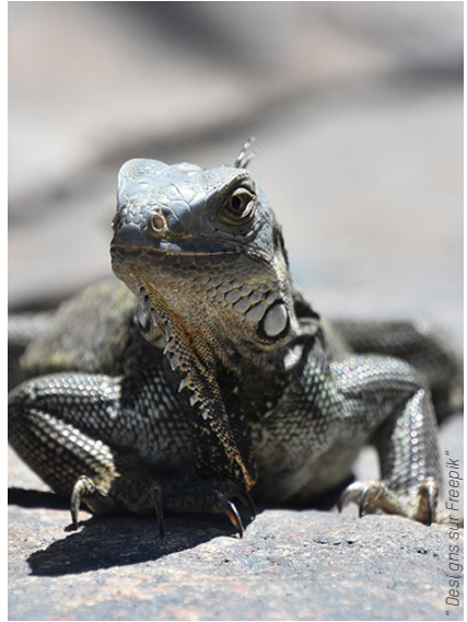
"Dees (ans sur Freepik"