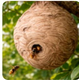
NID SECONDAIRE ÉTÉ – AUTOMNE