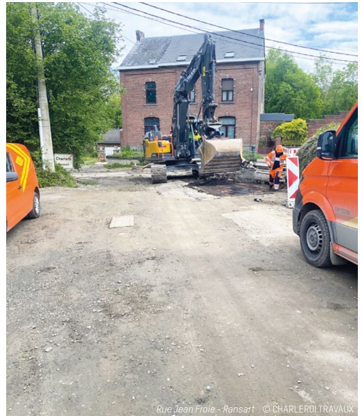
Rue Jean Froie - Ransart

Du côté de Charleroi-Nord, la rue Warmonceau verra prochainement sa voirie rénovée dans la foulée du remplacement de la conduite d'eau par la SWDE. Le budget consacré à cette opération avoisine 1,70 million d'euros TVAC.