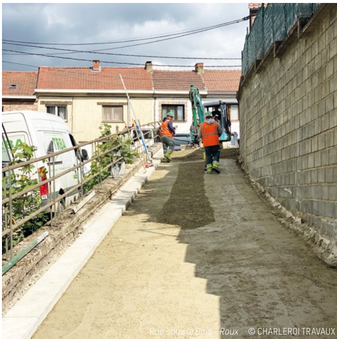
Rue sous le Bois - Roux

À Roux, le chantier de la rue Sous-le-Bois entre progressivement dans sa phase finale. Après la pose de la couche finale entre les Etangs Caluwart et le numéro 35 de la rue Sous-le-Bois, la rénovation de la Rue Foucremont et l'installation d'aménagements de sécurité, les équipes poursuivent l'installation de l'égouttage et la reconstruction du reste de la voirie sur le tronçon situé entre le no 35 et la Rue de Heigne. L'investissement de 3,01 millions d'euros TVAC doit permettre d'améliorer durablement le cadre de vie et la sécurité des riverains.